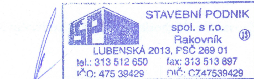
za Zhotovitele Aleš Příbyl, jednatel společnosti

Příloha tohoto dodatku: položkový rozpočet víceprací