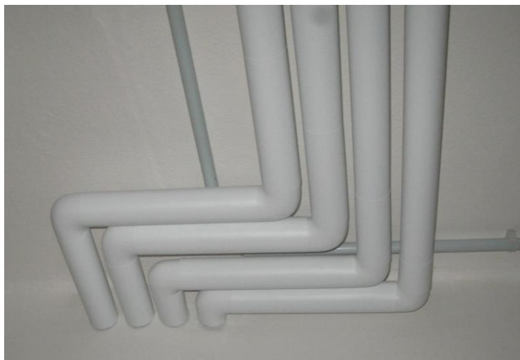
Obr.: Vzorové provedení tepelných izolací vedených mimo technické prostory, opatřených PVC fólií

Potrubí ÚT bude opatřeno tepelnou izolací dle vyhlášky 193/2007 Sb. Ležaté potrubní rozvody vedené v nevytápěných prostorách v suterénu objektu budou opatřeny tepelnou izolací z tepelně izolačních návleků z minerální vaty, kaširovaných Al-fólií. Stoupací potrubí vedené přes 1.NP bude izolováno pomocí polyethylenových tepelně izolačních návleků. Tyto budou opatřené PVC fólií tloušťky 0,35 mm v bílé barvě určené pro povrchovou úpravu tepelných izolací. Tvarovky budou provedeny systémovým řešením výrobce PVC folie. Potrubí ÚT vedené od stoupacího potrubí k otopným tělesům ve vytápěné místnosti bude bez tepelné izolace a opatřené dvojitým reaktivním nátěrem v bílé barvě. Izolování potrubí dle značení ve výkrese.